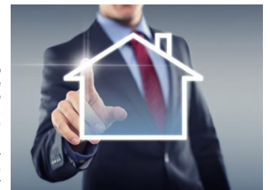
Profissão Corretor de Imóveis

O SINDIMOVEIS-GO adverte que antes de contratar um corretor de imóveis, é de extrema importância verificar se o profissional em questão está inscrito em seu conselho de classe, o órgão regulamentador da profissão, e se a identificação está em dia. O melhor é entrar em contato com o conselho de sua região antes de fazer qualquer acordo com um profissional desconhecido.