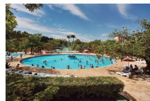
Turismo Sesc-Caldas Novas-GO

Para usufruir do convênio, acesse o site - www.sindimoveis-go.org.br e faça sua adesão ao SESC-GO.