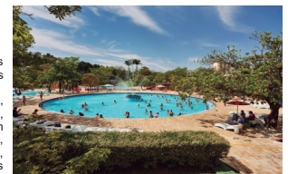
Turismo Sesc-Caldas Novas-GO

Para usufruir do convênio, acesse o site - www.sindimoveis-go.org.br e faça sua adesão ao SESC-Goiás.