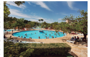
Turismo Sesc-Caldas Novas-GO

Para usufruir do convênio, acesse o site - www.sindimoveis-go.org.br e faça sua adesão ao SESC-Goiás.